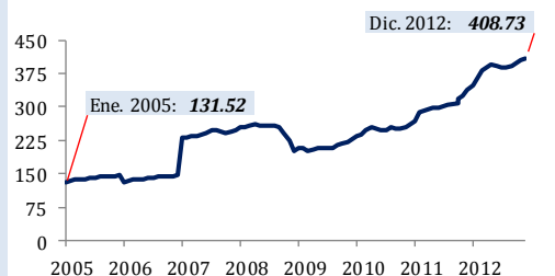
Indice BVPA - Enero 2005 - Diciembre 2012

Este año el índice de la BVP registró un excelente desempeño al cerrar en 408.74 unidades con rendimiento anual de 20.58%.