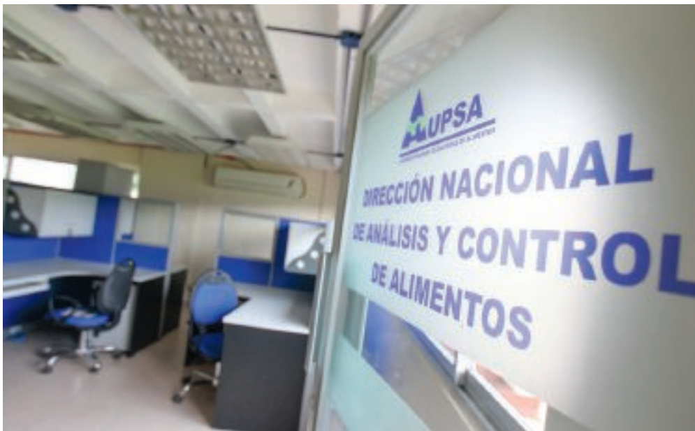
Con la Aupsa, la importación de alimentos no requiere de permiso, licencia o autorización previa alguna, lo que pone en riesgo la salud de los panameños y la producción de alimentos.

El proyecto de ley 164 podría entrar hoy en segundo debate en el pleno de la Asamblea Nacional.